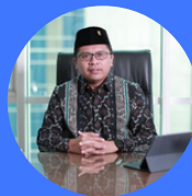
H.E. Zuhairi Misrawi (The Indonesian Ambassador To Tunisia)